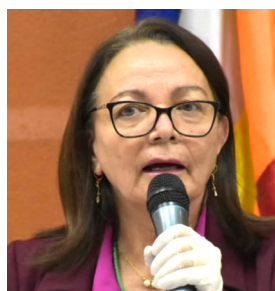
Dra. Eidy Roca Viceministra de Salud y Promoción

"En los municipios que tienen riesgo alto debemos tomar ciertas medidas y precauciones para que bajen a riesgo medio y moderado, siempre por etapas. El Ministerio de Salud va a colaborar y trabajar de manera conjunta con los municipios y gobernaciones para asumir medidas que ameriten".