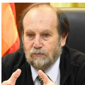
Dr. Marcelo Navajas, Ministro de Salud